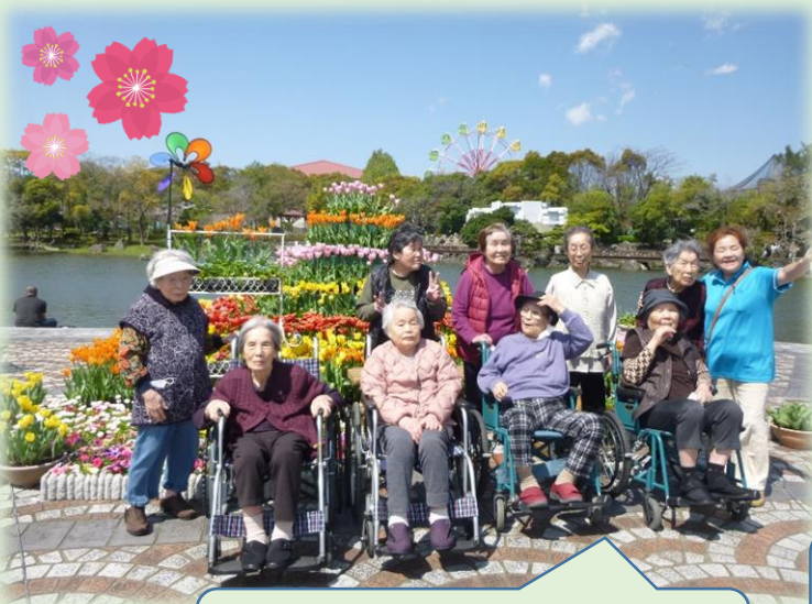
わんぱーく高知・・・お花見に行ってきました。全員で記念写真