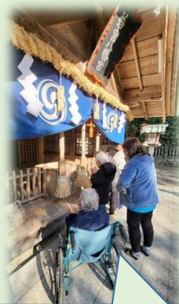
皆様～どうぞ楽しい一年！よろしく！