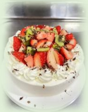
ステラの パティエ 手作り ケーキ です