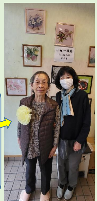
ご家族の方と・ ご自身の作品と一緒に