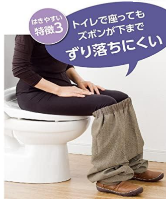
ずり落ちにくいズボン