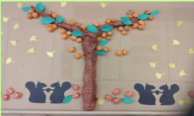
皆様で作成した、秋の味覚創作