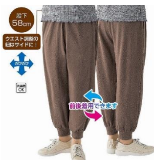
前後どちらでも履けるズボン