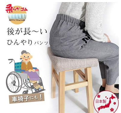
後ろが長いズボン