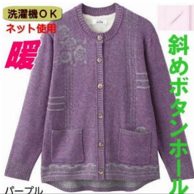
大きめ斜めボタンがとめやすい

いの町周辺の店舗購入： サンプラザに入っている「EL エル」さんに、高齢者の体に配慮した衣類がありますね。