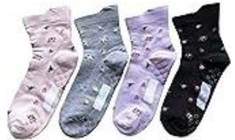
名前記入場所あり。 ゴム緩めソックス